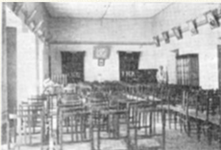
O SALÃO NOBRE DA ACADEMIA MATTOGROSSENSE